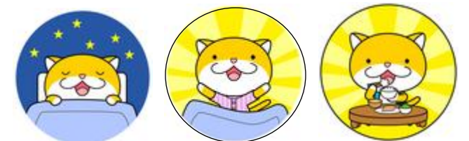
はやね・はやおき・あさごはん

朝ごはんを食べるためには、早寝・早起きはかせませせん。寝ている間にも、脳は活発に働いていて、朝起きた時には、脳のエネルギーは空っぽになっています。しっかり朝ごはんを食べて、エネルギーをまんたんにして、元気に登校しましょう。