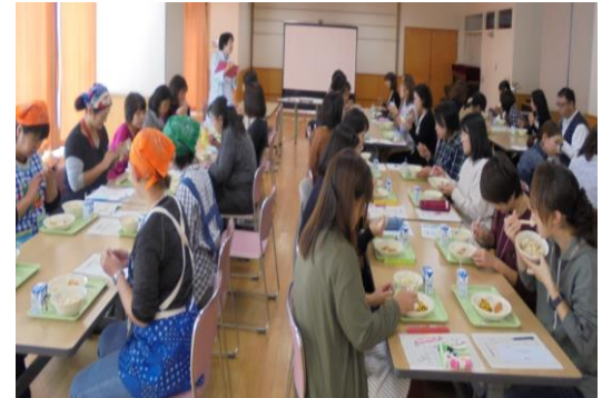
参加者の御感想より

昨年度に続き、1年生の保護者の方を対象に「PTA 試食会」を開催しました。給食室の様子、学校給食について、朝ごはんについてなどをお話させていただきました。給食を試食した後は、1年生の給食を参観しました。保護者の方と直接お話できる貴重な場となりました。御参加いただきまして、ありがとうございました。